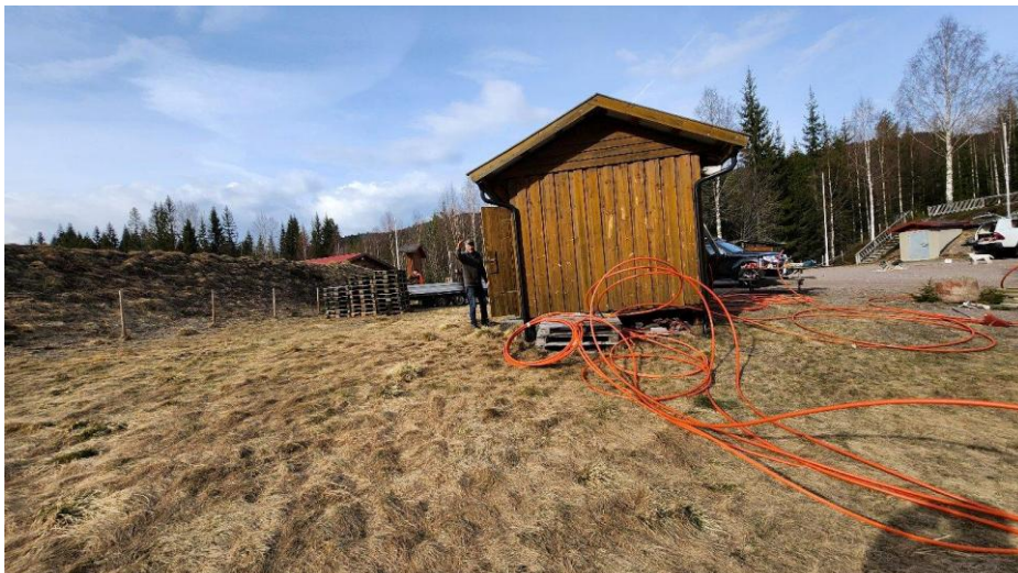
Kabeltrekking av akustiske kabler