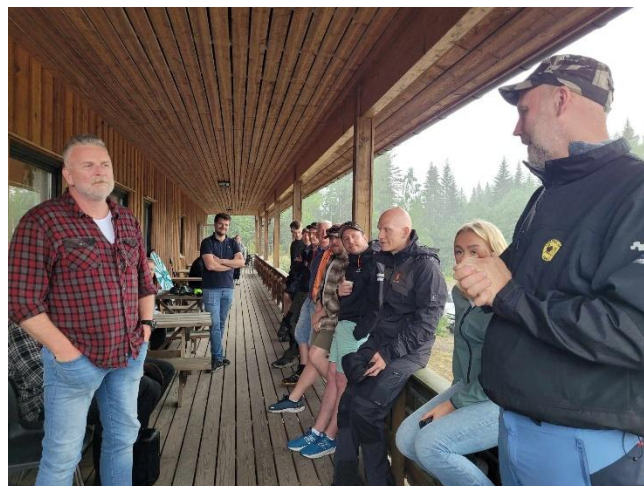
Åpning av bane.