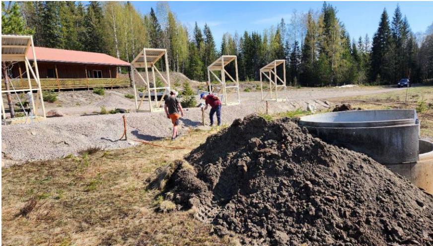
Dugnad haglebane, montasje av akustiske mikrofoner