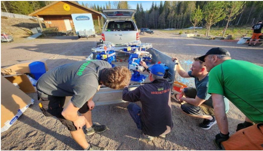
Opplæring på nye kastere