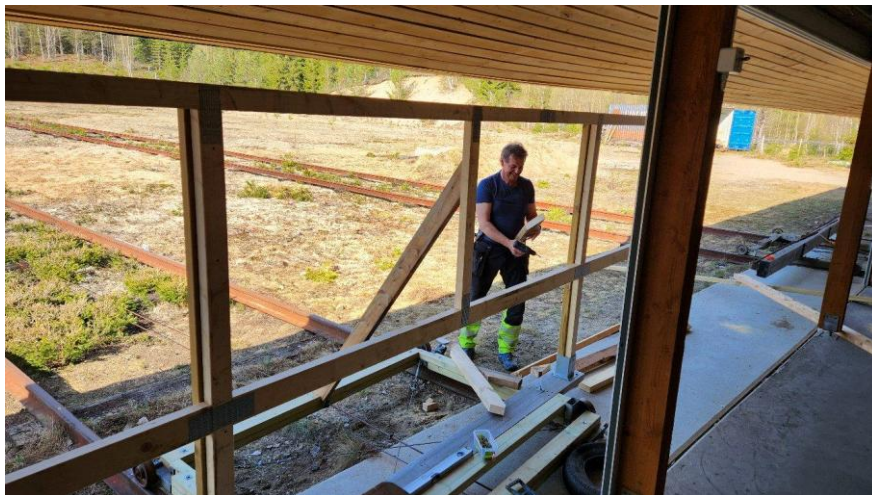
Montasje av nye skivevogner