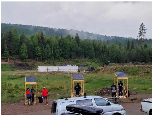
Test av bane. Nyåpning