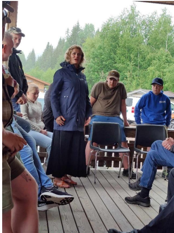
Sparebankstiftelsen kom på åpningen