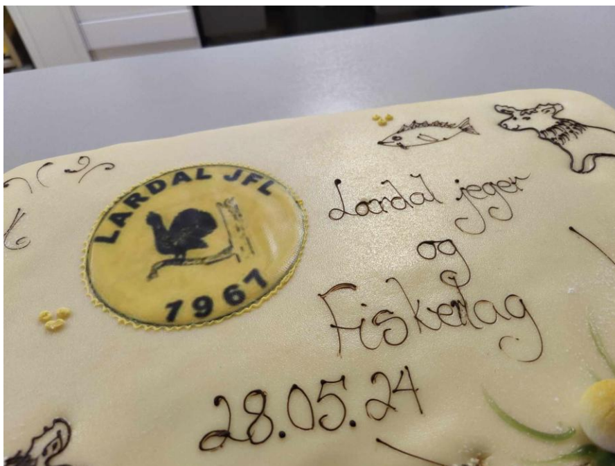
Åpning av haglebane