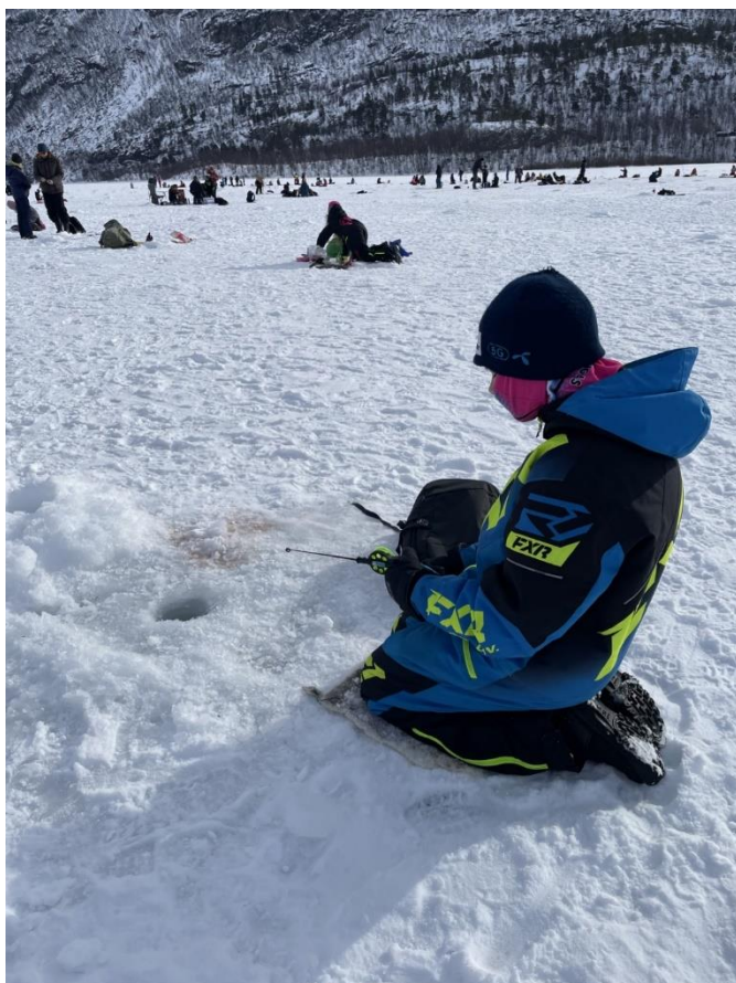
Bildetekst: Isfiskekonkurranse på Mathisvann for alle kommunens 5. klassinger.

Våren 2024 gjennomførte barn og ungeutvalget flere ungdomstreff, arrangert Fiskesommer og isfiskekonkurranse for 5.klassinger i Alta. Vi har kjøpt skytesimulator med VR-briller og har testet det på ungdomstreffen, men vi må få overført til storskjerm slik at dette blir mer inkluderende for alle.