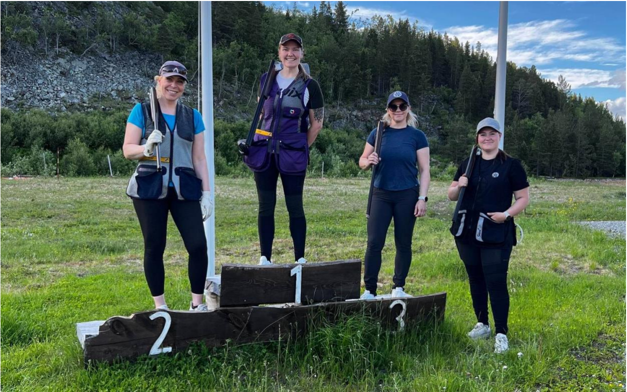
Jentetreff i Alta våren 2024.