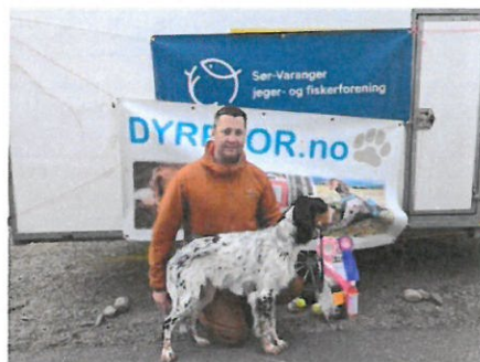
BIS Valp Komagdalen's Tn