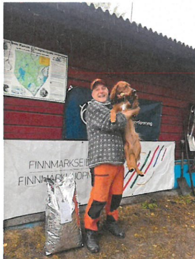
Prøvens beste hund skog