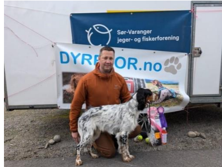
BIS Valp Komagdalen´s Tn