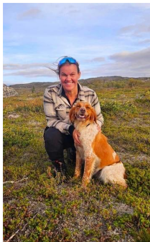
Prøvens beste AK