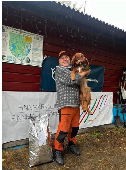
Prøvens beste hund skog