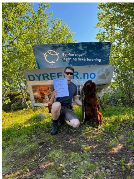
Beste AK apport