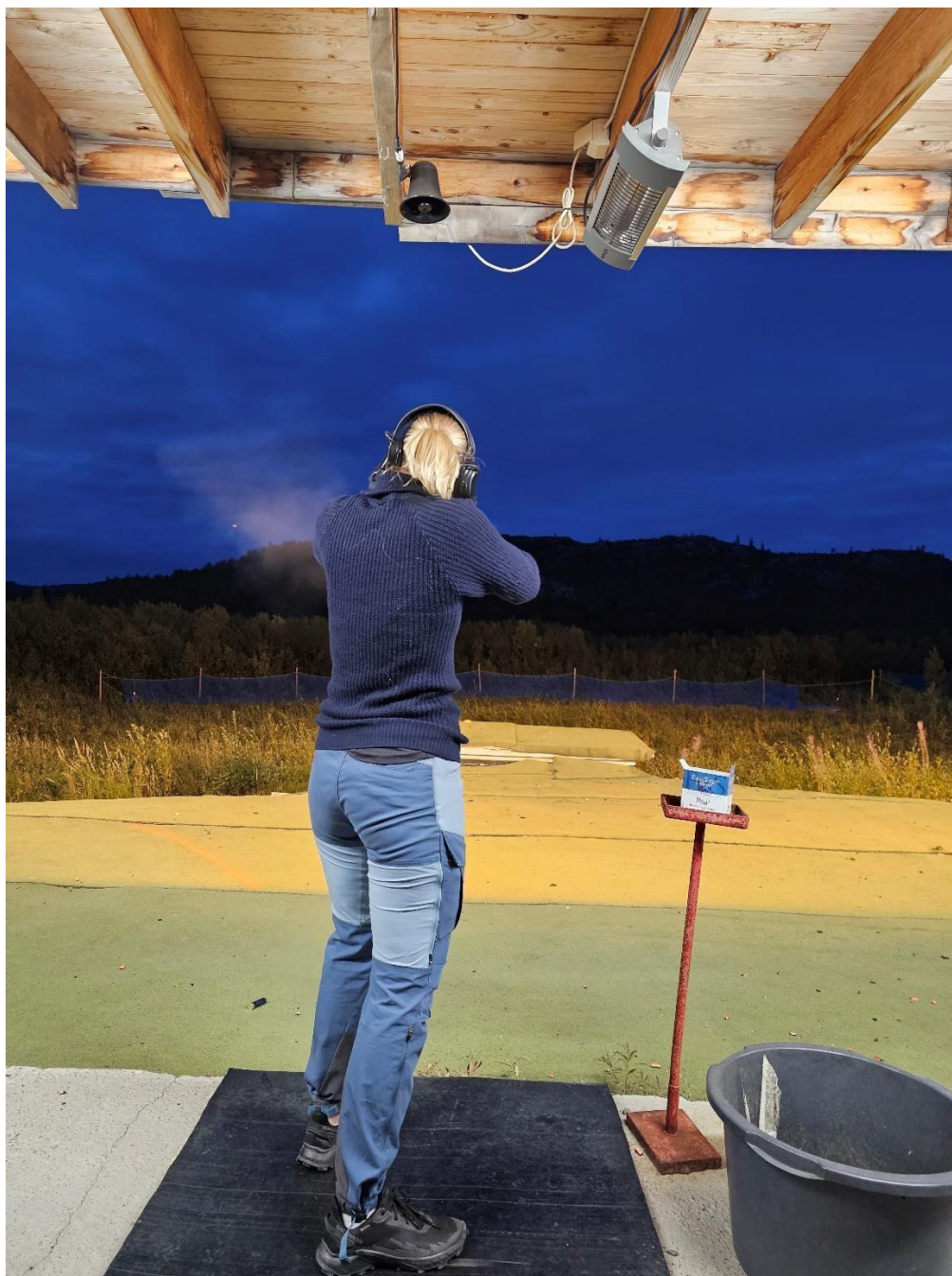
Telt- og fisketur, 1.-2. juni

Sommeren lot vente på seg og vi hadde få påmeldte, men vi valgte likevel å gjennomføre telt- og fisketur første helgen i juni. Det ble fangst tross tidlig sesong, men også hyggelige samtaler rundt bålet.