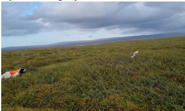
ES Hilux på taksering i Bergeby

Alle linjer hadde flere hundekvipasjer tilgjengelig og det er flere som melder sin interesse for å bidra til dette oppdraget. Det vil derfor i 2025 bli prioritert å gjennomføre kurs for nye linjetakstører og linjeledere.