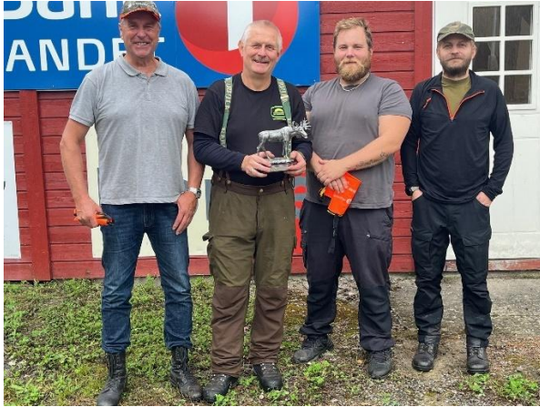
Rasaberget jaktlag, beste jaktlag på elgjegerdagen 2024

Hedemarkenkarusellen og Mjøskarusellen i elgskyting ble gjennomført i 2024.