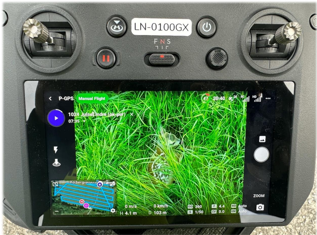
Funn av rådyrkalv midt i bildet, flyge plan ned til venstre.