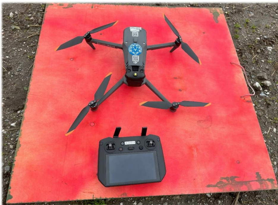
Dronene som ble brukt: DJI Mavic 3T.

Dette har vi muligheter til å forbedre i 2024, der gressprodusentene kan tegne inn teigene sine i god tid, gjerne i vinterhalvåret, slik at dronepilotene eller annen person har godt tid på å lage flyge planer for å være best mulig forberedt den dagen gresset skal slås. Effektiviteten vil på denne måten økes under flyging i juni, slik at vi kan fly over store arealer på relativt kort tid