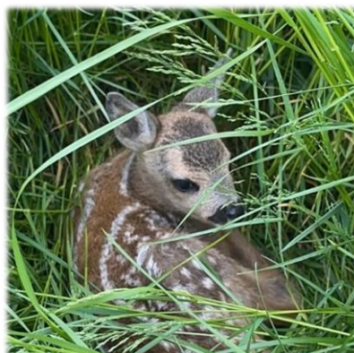
Funnet rådyrkalv i gresset

Findbambi - god dyrevelferd og bærekraftig ressursforvaltning!