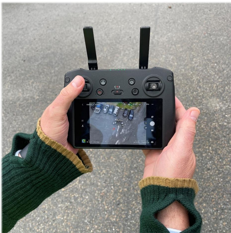
Små skjermer på styrekonsollen

Et nettbrett ville kanskje vært det optimale, for da kan dronepilotene gå inn og endre på eventuelle flyge planer, der det måtte være behov for dette. Det skjedde flere ganger i 2023 at vi måtte gå inn å endre på flyge planer på stedet der vi skulle foreta søk, fordi vi så fysiske hindringer, eller andre utfordringer som vi ikke kunne forutse når vi satt hjemme og lagde flyge planene digitalt. Dette er også en av årsakene til at det er viktig med prøve flyging av teigene i god tid før søk, da kan dronepilotene gjøre justeringer på stedet, slik at alt er klart til selve søket skal utføres. Vi ønsker derfor å se om vi kan få nok midler til å kjøpe inn ekstra skjermer og/eller nettbrett til dronene i 2024.