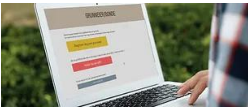
Digitalt kart- og registreringssystem

Ettersom vi hadde begrenset med tid til å ferdigstille et kart- og registreringssystem til prosjekt oppstart, ble bare et midlertidig system utviklet. Systemet fungerer ikke optimalt, er delvis tungvint, spesielt for gressprodusentene, og lite effektivt ift. tidsbruk for piloter og koordinators. Under evalueringssmøte 4.10.23 kom vi i fellesskap frem til en del forbedringsområder i 2024, disse er opplistet under avsnittet «Konklusjon»