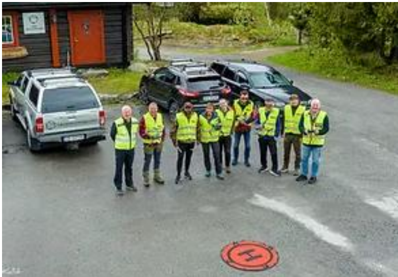
Dronebilde av dronepilotene på kurs

Heldigvis for oss, hadde vi en lang og kald vår, slik at gresset vokste sent, og slåttene kom mye senere i gang enn normalt. Det ble desto mer hektisk i perioden førsteslåttene varte, da alle bøndene skulle slå nesten samtidig innenfor en kort tidsperiode, 1 – 2 uker.