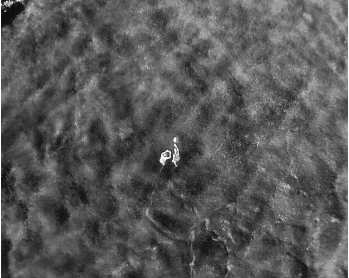
Medhjelpere og en lokalisert rådyrkalv sett ovenfra med IR kamera modus (white hot).