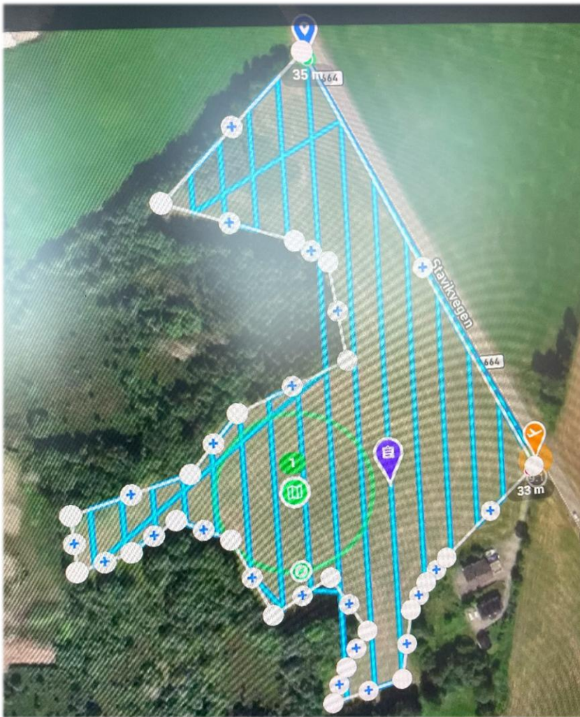
Eksempel på flyge plan på styrekonsoll skjermen