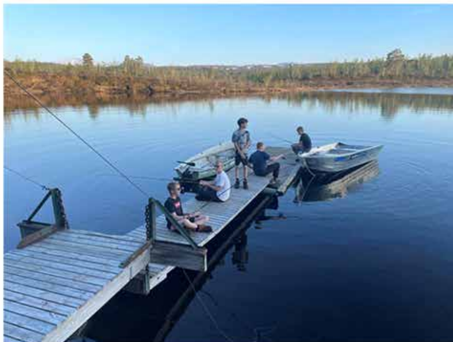
JOFS 2023 på Vaulen