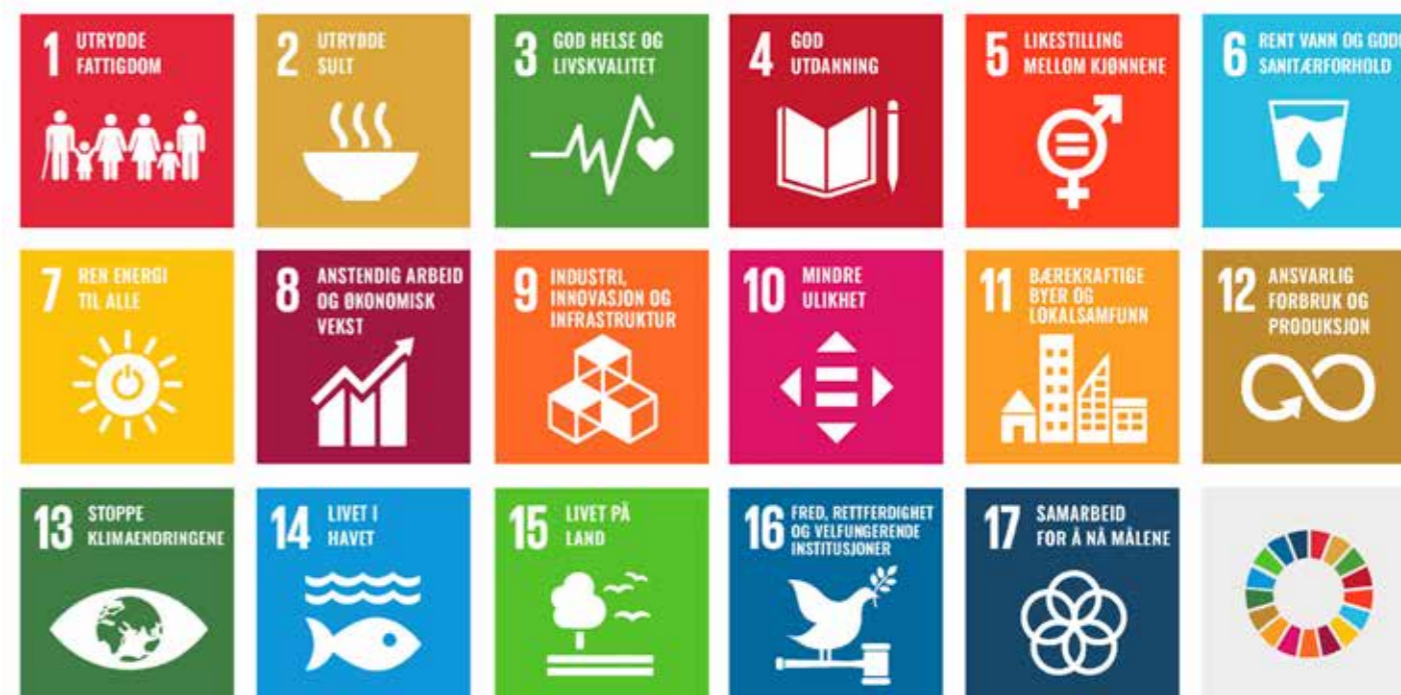
Illustrasjon: FN-sambandet i Norge.

Handlingsprogrammet vil sammen med miljøstrategien og årlige arbeidsprogram peke ut kursen og innsatsområder for organisasjonen både når det gjelder hva organisasjonen selv skal gjøre og hvilke krav og forventninger vi skal stille til samfunnet.