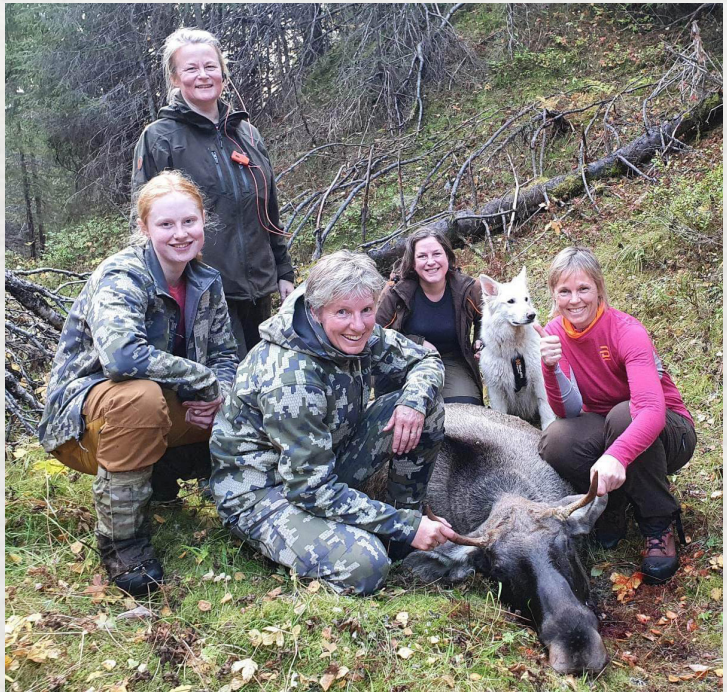
Et fornøyd jaktlag!