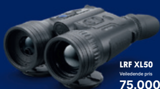
LRF XL50 Veiledende pris 75.000,-