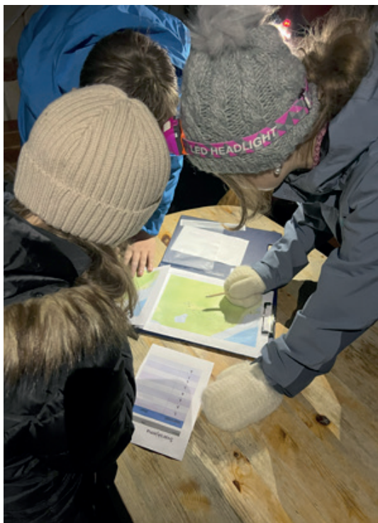
Å bruke høstmørket til orientering var nytt for mange, men mulighetene er mange når hodelykten er på plass.

Lørdag var bakken kald og full av rim, men dagens program var likevel fullt av aktiviteter som skulle hjelpe ungdommene å holde varmen. Først ut var friluftskonkurransene i Full Fræs, som gav ungdommene både hodebry og fysiske anstrengelser. Lunsjen måtte selvsagt laget ute denne dagen, og både bål og stormkjøkken ble benyttet for å lage et flott vegetarmåltid. Fra bodø acti-onhall fikk vi besøk, og ungdommene ble svært fornøyde når de fikk vite at vi skulle bruke bjørkeskogen til å spille lasertag sammen etter lunsj. Når vi hadde brukt opp all energi på lasertag, ble det en svært etterlengtet pause frem til middag. Siden det kun var noen dager