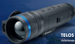
TELOS XP50 Veiledende pris 42.000,-