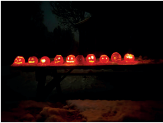
Utskårne appelsiner lyser opp.

frem til halloween, benyttet vi muligheten til å lage utskjært appelsin (i stedet for gresskar). Alle fikk utlevert hver sin appelsin, og fikk skjære ut etter egen fantasi. Med et telys i hver, lyste de pent opp i høstmørket.