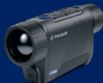
XQ35 PRO Veiledende pris 21.000,-