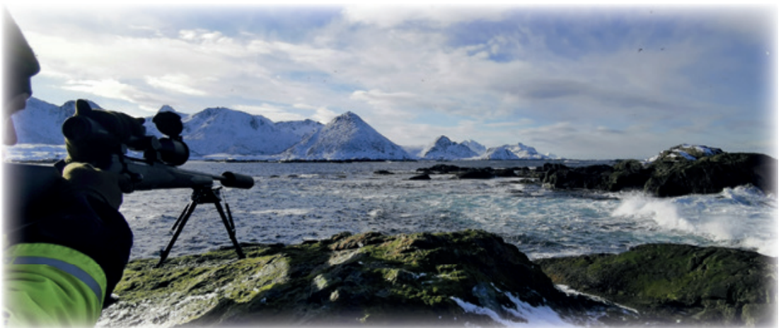
Einar sikter i strømmen.