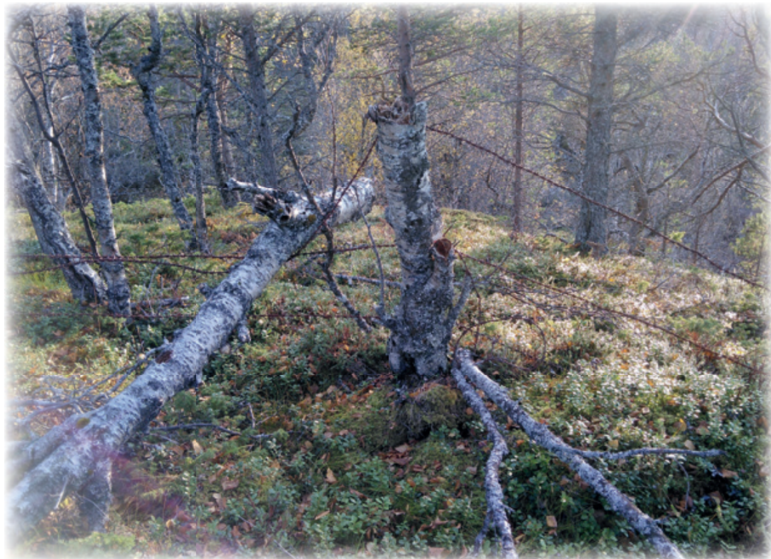
Trærne vokser med piggråd.

Tekst: Ylva Edvardsen-Kvam