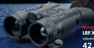
Nyhet! LRF XQ35 Veiledende pris 42.000,-