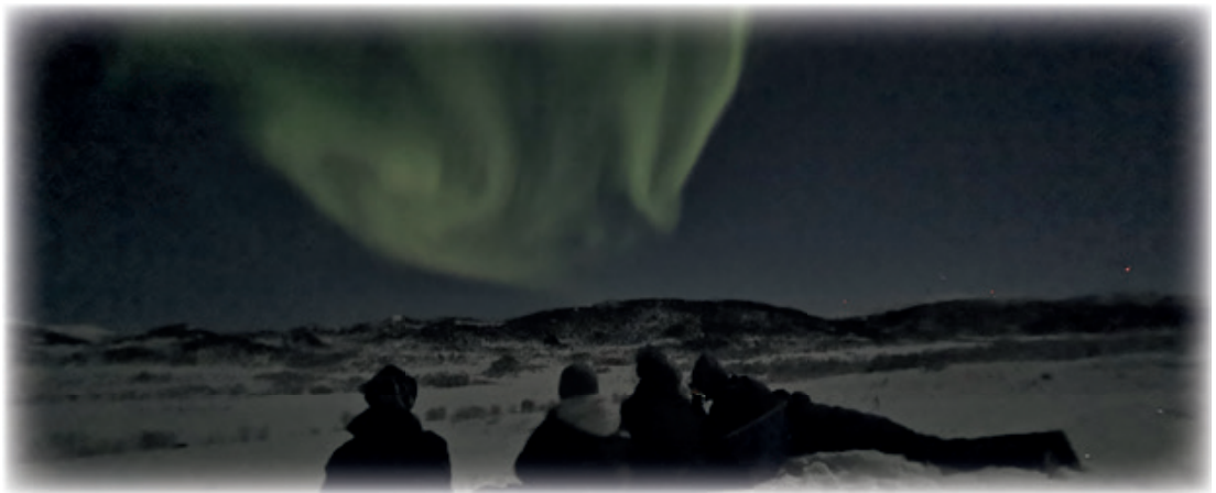
Lokking i nordlys.

28. november Introjakt på rev med lokking. 8 unge nyutdannede jegere deltok og vi startet med teori og gjennomgang av utstyr og en rekke lokkemidler, alt fra hjemmelagede tenerfield «blekk»lokk, og mange «plastfløyter», NJFFs gode lokkelyder i appen og blåtannhøytaler, til elektroniske lokker med fjernkontroll og bevegelig bulvan/fjærdusk. Det ble mange nifse lokkelyder i kurslokalet den kvelden, og mye latter. Med 8 ivrige jegere måtte vi trekke lodd om hvem som skulle ha rifle på de 2 lokkepostene.