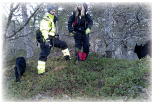
Deler av jaktlaget som benytter elgjakta til å rydde gamle gjerder.

Dette er en gylden mulighet for lokalforeningene våre til