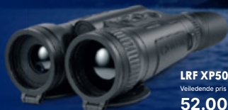
LRF XP50 Veiledende pris 52.000,-