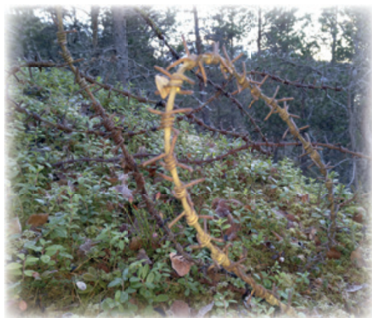
Gammel rusten piggråd.

Gammel piggråd i utmark kan i enkelte områder være et problem! Et jaktlag i Narvik brukte store deler av elgjakta si, til å rydde og fjerne gammel piggråd fra krigens tider. Problemer med denne piggråden er ofte at den er festet i trær og ved vekst av denne, vil piggråden gro inn i treet og bli med på veksten. Rusten piggråd blir ikke mindre skarp med årene, og slike etterlatenskaper blir til fare for vilt, bufe og ikke minst hunder brukt i jakt og ettersøk. Å få klærne ødelagt på tur i skogen er heller ikke noe særlig og det er nok mange som i årenes løp har hengt fast buksebaken i piggråd når man prøvde å klatre over.