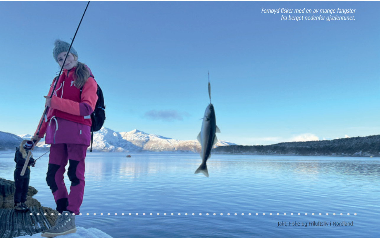
Fornøyd fisker med en av mange fangster fra berget nedenfor gjælentunet.