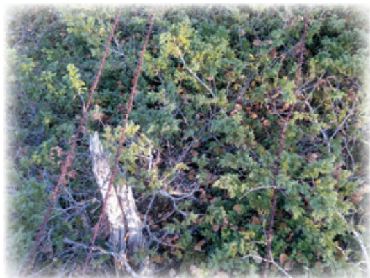
Gamle gjerder til skade for vilt, bufe og folk.