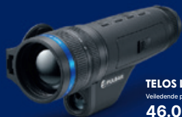
TELOS LRF XP50 Veiledende pris 46.000,-