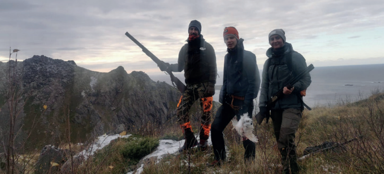
3 jegere på introjakt i Nyksund