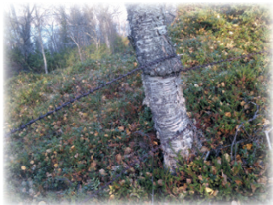
Når trærne vokser med piggråd.

Har dere bildemateriale fra slik problemstilling, så tar vi gjerne mot disse. Dette vil benyttes til dokumentasjon for å sette fokus på dette fremover. Send inn til nordland@njff.no og merk bildene med område, kommune og hvilket lokallag du tilhører.