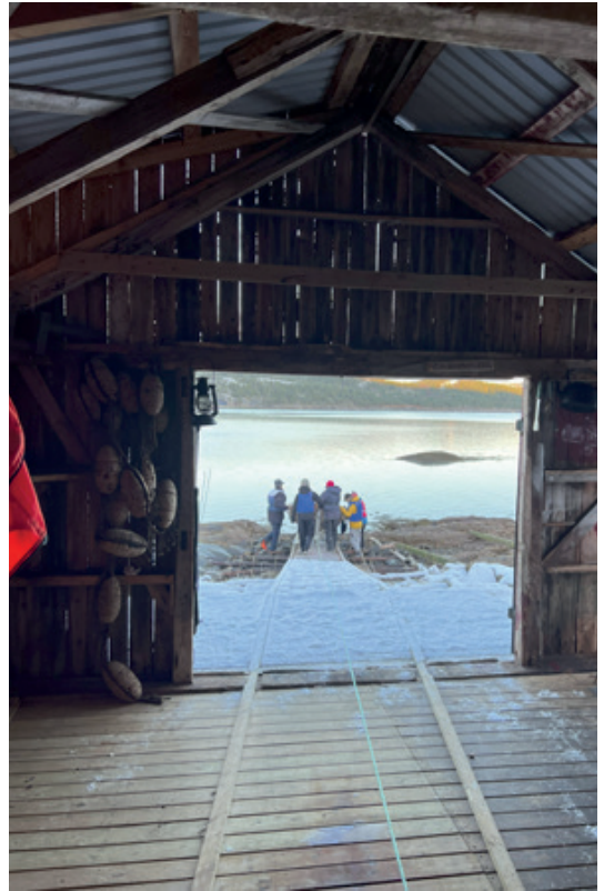
Gjennom samarbeid fikk ungdommene ut begge båtene.

Søndag våknet vi opp til et snødekt høstlandskap! Og denne dagen skulle vi ned til fjæra for å teste fiskelykken. Noen ønsket å ta ut båtene fra naustet, for å se om fisken bet best utpå dypet. Mens noen andre ville prøve lykken fra berget. Etter noen timer fiske kunne vi slå fast at denne dagen var fisket mest bitevillig med sluk fra land, på odden som var nøye valgt av en ivrig fiskeinteressert jente.