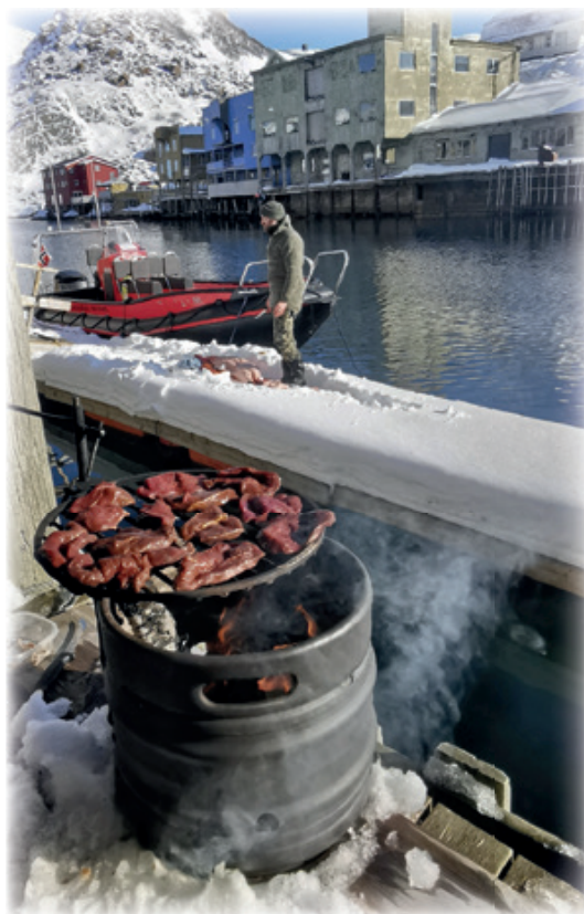
Rib og båltonna

Med 9 deltagere ble praktisk posteringsjakt ikke gjennomført denne kvelden.