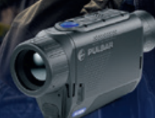
XM30F Veiledende pris 14.000,-