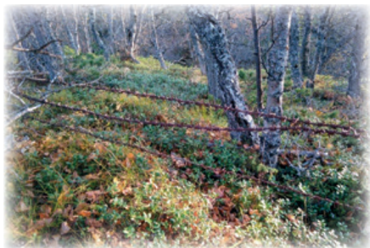
Gamle gjerder i utmark.