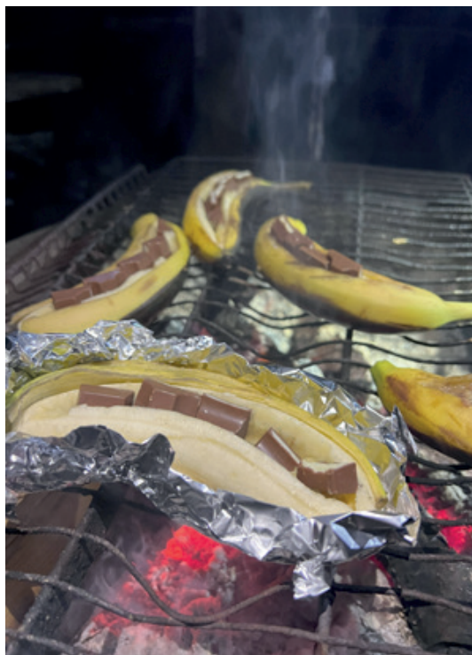
Banan med sjokolade er en perfekt dessert ute på bålet.