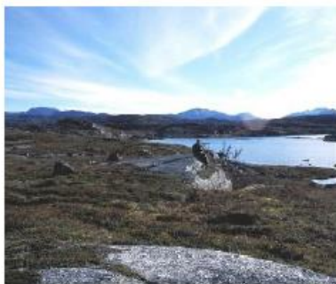
Sommerstemning ved Skomakeren