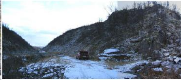
Stien til Haugfjell fra Urdalen

En alternativ adkomst til StoreHaugfjell og en grei adkomst til Lille Haugfjell har du ved å stanse der E-10 gjør en nesten 90 graders sving i Urdalen. Den første biten er det sti. Denne starter like ved der en bekk kommer ned bakken og munner ut i Urdalselva. Etter ca 1 km er man oppe ved Store Smedvann, det første vannet på Lille Haugfjell. Dette vannet har feil navn på 1:50 000 kartet, vannet står her benevnt Jeksla, med dette vannet ligger lenger opp på høyden mot Søsterbekk. Andre gode alternativ for å nå dette området er å gå fra parkeringsplassene like ovenfor Urdalen eller Søsterbekk. Det mest kjente fiskevannet på Lille Haugfjell er Skomakeren. Foreningen setter ut fisk i mange av småvannene på Lille Haugfjell.