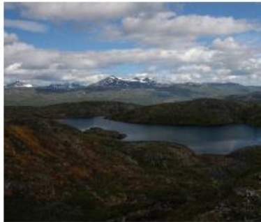
NOJFF kultiverer mange småvann på Store Haugfjell