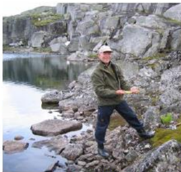
Ørrefangst på Haugfjell