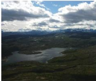
Bak Jernvannet ses Lille Haugfjell til venstre og Store Haugfjell til høyre; Foto Knut Aune Hoseth

En alternativ adkomst til StoreHaugfjell og en grei adkomst til Lille Haugfjell har du ved å stanse der E-10 gjør en nesten 90 graders sving i Urdalen. Den første biten er det sti. Denne starter like ved der en bekk kommer ned bakken og munner ut i Urdalselva. Etter ca 1 km er man oppe ved Store Smedvann, det første vannet på Lille Haugfjell. Dette vannet har feil navn på 1:50 000 kartet, vannet står her benevnt Jeksla, med dette vannet ligger lenger opp på høyden mot Søsterbekk. Andre gode alternativ for å nå dette området er å gå fra parkeringsplassene like ovenfor Urdalen eller Søsterbekk. Det mest kjente fiskevannet på Lille Haugfjell er Skomakeren. Foreningen setter ut fisk i mange av småvannene på Lille Haugfjell.