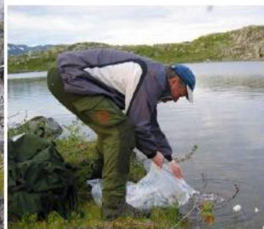
Fiskeutsetting på Lille Haugfjell