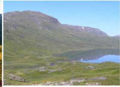
Sommerstemning, hytta ved utløp til venstre