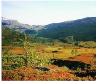
Bukkedalen inn mot Nævra