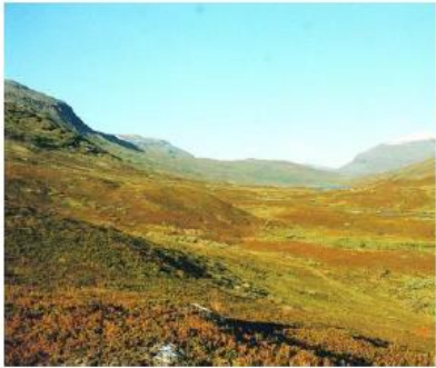
Inn mot Gressvannet