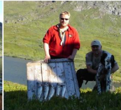
Fra Gressdalen i August 2006

Gressvannet har en bra ørretbestand, og det var i dette vassdraget NOJFF tidligere foretok stamfiske. Det er også småvann i Gressdalen med fin ørret. Berggrunnen er kalkrik i området, og det er derfor høy næringsproduksjon i vannene i området. Det er bla marflo i Gressvannet. Gressvannet var fisketomt inntil foreningen første gang satte ut ørretyngel her i 1921. Det er nå naturlig reproduksjon i vannene i dette området.