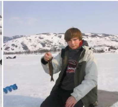
Isfiskedag for Ankenes Ungdomsskole på Geitvannet i april 2006; Foto Vebjørn Pedersen

Ved Holmervann har NOJFF bidratt til bygging av kommunens eneste fiskeplass som er tilrettelagt for handikappede. Adkomst til denne er fra veien inn til Bjørnfjell stasjon. I dette vannet er det fin ørret, så vi anbefaler bruk av denne fiskeplassen