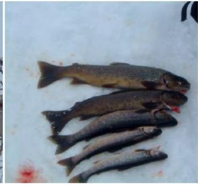
På Bjørnfjellsområdet er det både ørret og røye, her fra Geitvannet