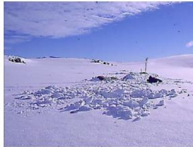
Flotte isfiskeforhold i påsken