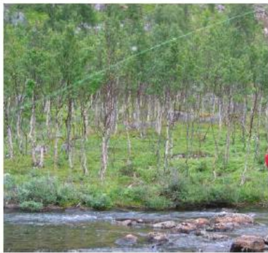
Karoline fisker ørret; Foto Knut Aune Hoseth