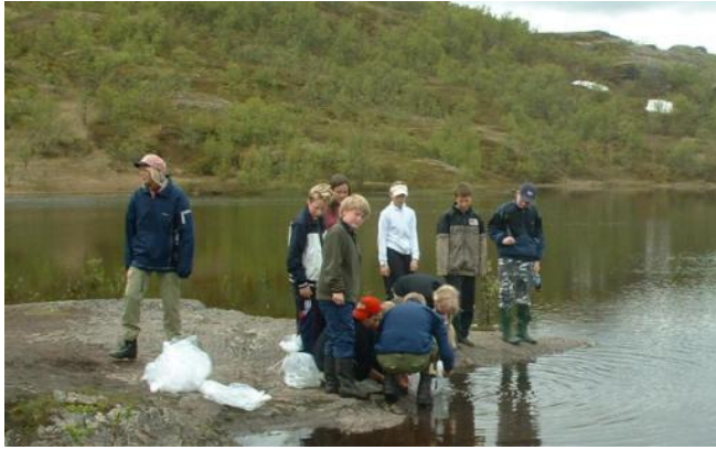
Utsetting av ørret i Førstevannet juni 2003