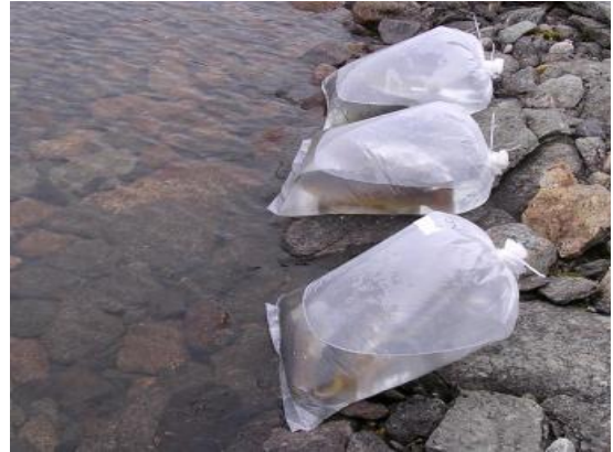
Utsetting av fiskespisende ørret i overbefolka vann høst 2003