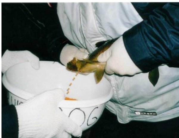
Neste generasjon sikres 2001