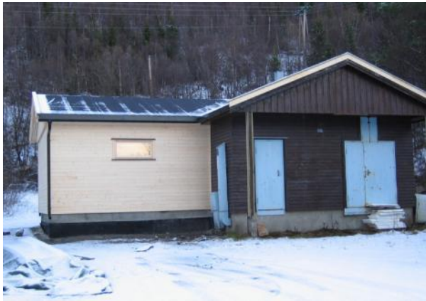
NOJFFs klekkeri, nybygget tar form høsten 2003

Og her følger bilder fra kultiveringsarbeidet: