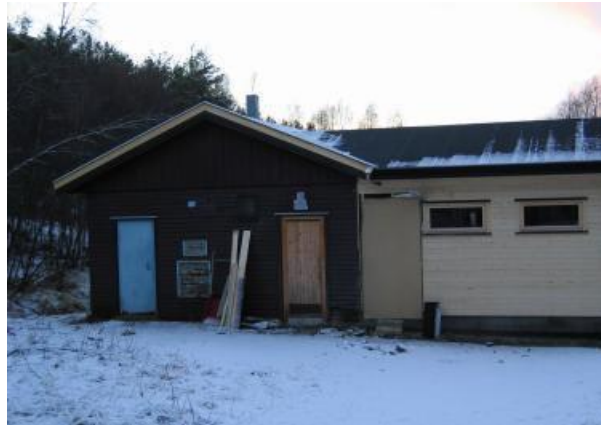
Fasaden sett fra den andre siden