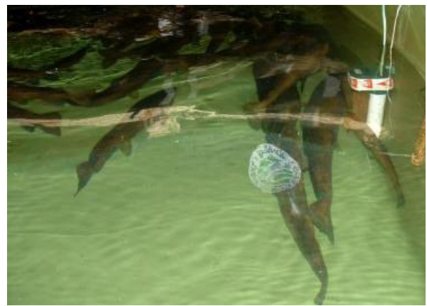
Noen av de største ørretene mai 2003

Fiskeutsetting skjer etter godkjente driftsplaner, og foreningen leverer fisk til flere grunneierlag. Statskog er den største grunneieren i kommunen, og NOJFF utøver fiskekultivering for Statskog i Narvikområdet. Foreningen har bidratt til utarbeidelsen til driftsplaner for Statskogs områder i Narvik. Foreningen har også samarbeid med flere private grunneierlag om forvaltning av innlandsfiske og kultivering. Fra 2003 overtok NOJFF ansvaret for forvaltning/kultivering av den lakseførende strekningen av Rombakselva.