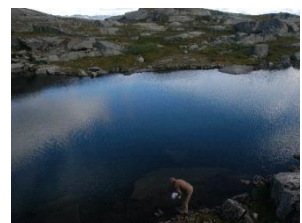
Trygve Jensen og Knut Aune Hoseth setter ut flybåren fisk i august 2007