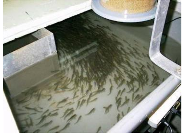
Førsteårs ørret mai 2003