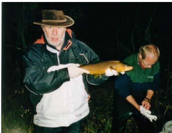
Forberedelse til stryking, 2001