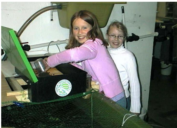
Mating må gjøres daglig mai 2003