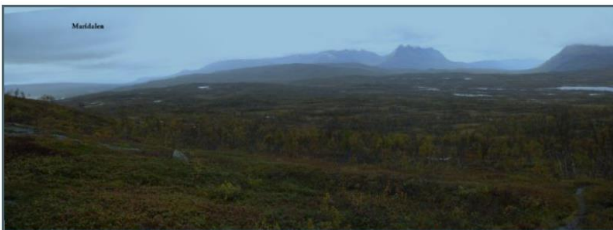
Mot Maridalen fra høyden nedenfor Storffjellet (Haugffjellet). Det største vannet på bildet er Maridalsvannet

Maridalen nås enten fra skogsbilveg ved Skog mellom Bjerkvik og Herjangen eller fra Herjangsfjellet. Området er kanskje mest kjent som utfartsområde vinterstid, men dette er også et flott område for turer sommerstid.