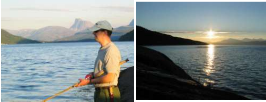
Småseifiske ved Skjomenbrua juli 2005

NJFF og Statens Naturoppsyn samarbeider om nettstedet www.ulovligegarn.no Vi anbefaler at opplysninger om ulovlige garn rapporteres her. Innrapportering kan også skje direkte til politiet på telefon 02800.