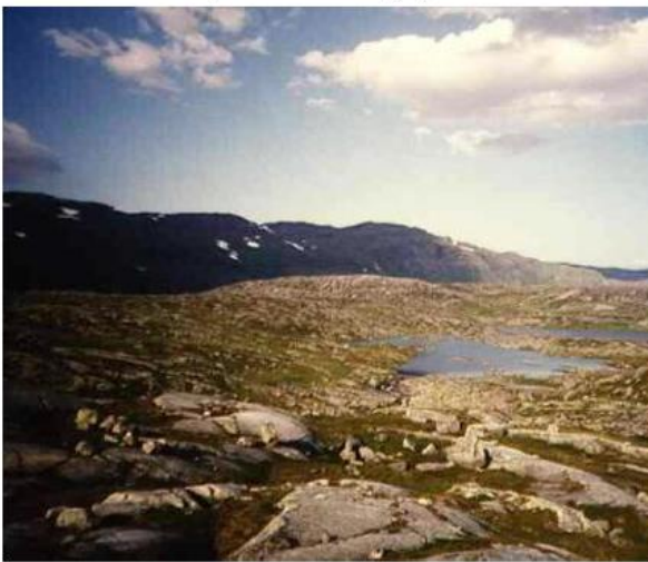
Nedre del av Store Holmvann