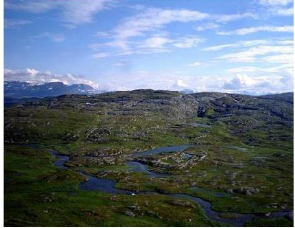
Elv mellom Lille Isvann (492 moh) og Svensk Holmvann

Det ligger mange vann også mellom Holmvannsområdet og riksgrensen, og det er fisk i de fleste av disse. Det er en del vann med overtallige bestander, men det er også vann i dette området som huser bra fisk. Ørndalen innenfor Geitvann er et naturskjønt område som anbefales for barnefamilier.