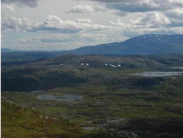
Karenvann til venstre og Holmvannene til høyre