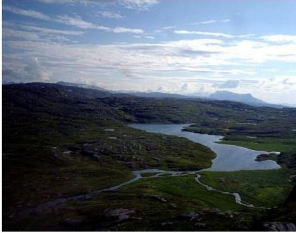
Lille Isvann (492 moh) sett fra Børseffellet