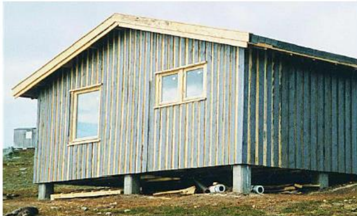
Hytta under oppføring; Foto Inge Larsen