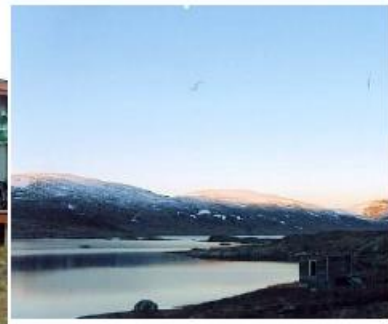
Ved hytta på Gautelis høsten 2007