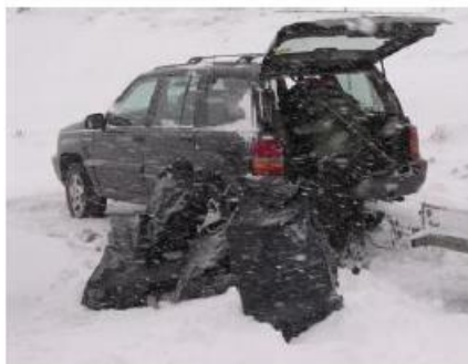
På Skjomenfjellet har mange blitt overrumpla av tidlig snøfall; Foto Gunnar Karlsen