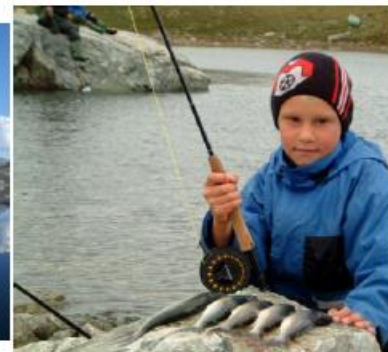
Røyefangst Gautelis