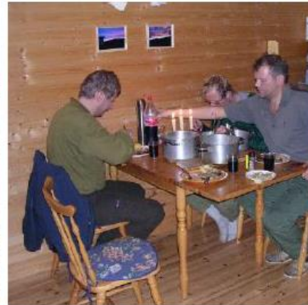
Mat må til på fjellturen