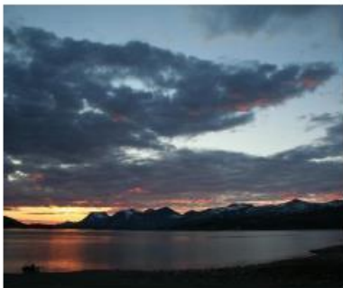
Fjellstemning på Gautelis august 2006