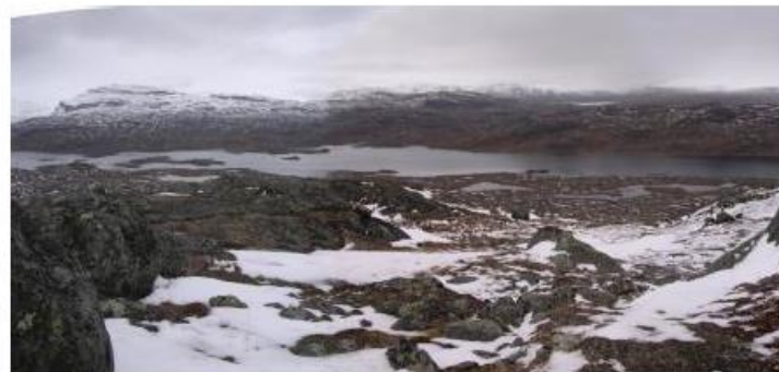
Utsikt over Gautelis (NOJFF hytta ligger på andre sia av vannet)