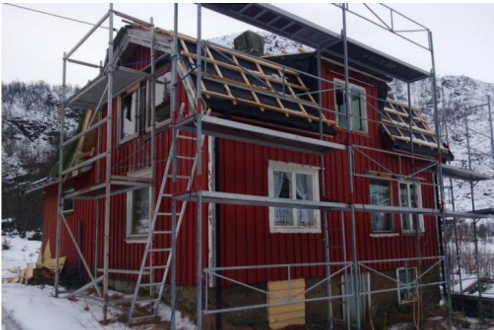
Restaurering av klubbhuset på Elverum i 2014