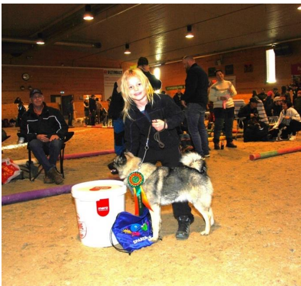
Yngste klasse Barn og Hund – under 6 år

I konkurransen» Barn og hund» fikk morgendagens hundeeiere vist frem sin beste venn. Dette gikk meget godt. Her har foreldre gjort et solid arbeid med trening av familiens håpefulle, både på to og fire bein. Rekrutteringen av nye hundesportsfolk virker god. Her er det bare å stå på videre. Dette går vegen!