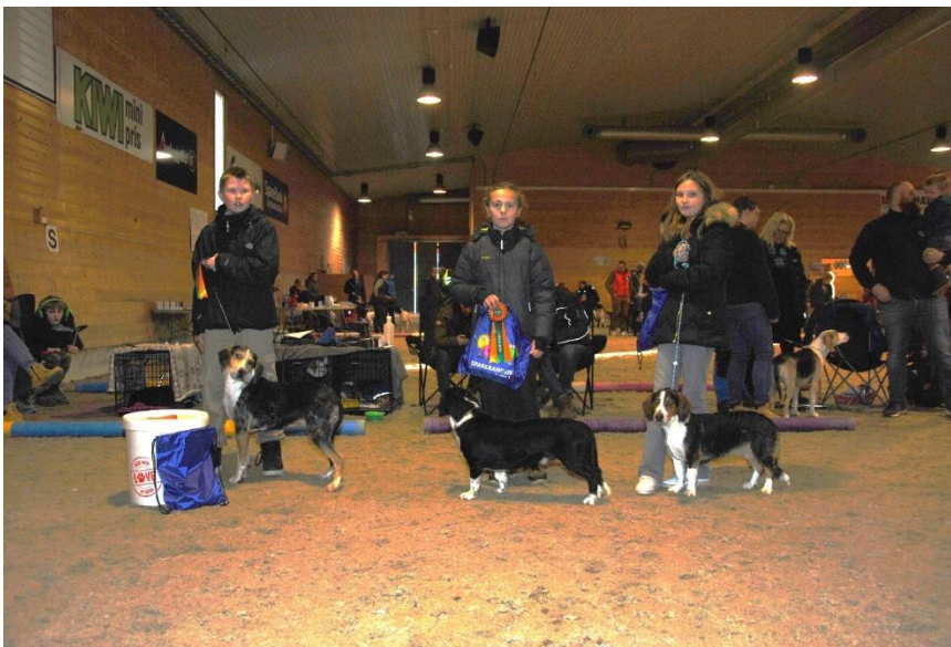
Deltakerne i eldste klasse barn og hund – over 10 år

De yngste hundene startet på valpeshow fordelt på de respektive rasene. Det var samme dommer som dømte alle hundene i samme rase, både valpene og de eldre hundene. Den interesserte hundeier kunne da se hvordan familiens stjerneskudd ville se ut i fremtiden. Hyggelig ringpersonell skapte i tillegg en særdeles trivelig stemning ved at de gjennom råd og dåd fikk hundene til å vise seg fra sin beste side, hvis det var behov for dette. De beste i hver gruppe konkurrerte til slutt om BIS-valp.