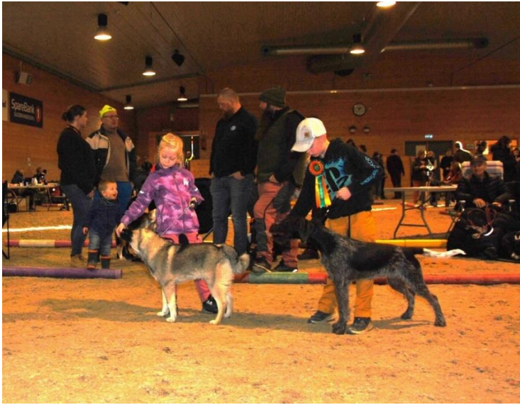
Resten av deltakerne i klasse 6-10 år