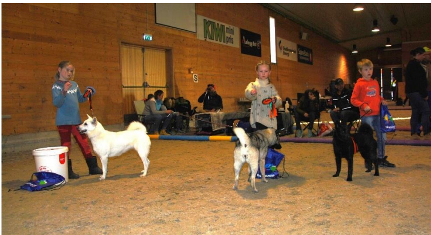
Tre av deltakerne i klasse 6-10 år