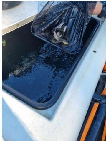
OFA stortank = 1000 liter og 1000 fisk!