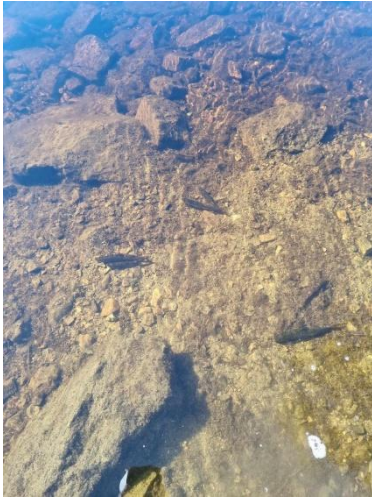
Sprelske ørreter i sitt nye vann!