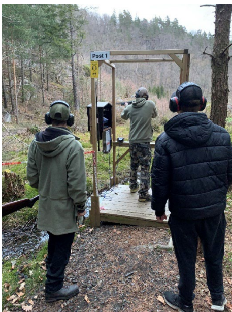
Unge skyttere på leirduestien

Lyngdal og Farsund jeger og fiskeforening var på besøk på banen vår en kveld i april. De stilte med 29 ivrige skyttere som fikk boltret seg på leirduestien og trapbanen. Grillen ble fyrt opp og pølser stekt for de som hadde tid til det i all skytingen. Alle virket fornøyde og vi har sett flere av dem komme og skyte på vanlige skytekvalder senere. Ny dag i 2025 er avtalt.